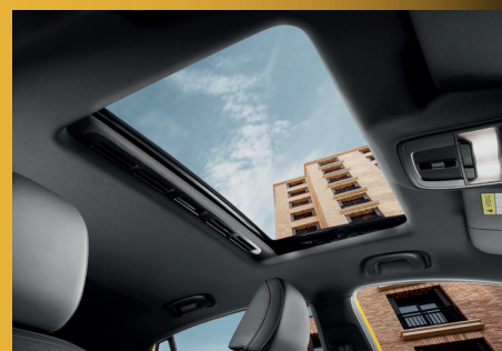
CỬA SỔ TRỜI VỚI 4 CHẾ ĐỘ ĐIỀU CHỈNH*