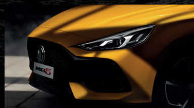
ĐÈN PHA LED TỰ ĐỘNG