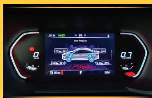
CẢM BIẾN ÁP SUẤT LỐP TRỰC TIẾP (TPMS)