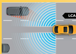
Hệ thống hỗ trợ chuyển làn*