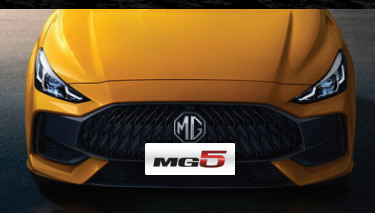
LƯỚI TẢN NHIỆT KỸ THUẬT SỐ THIẾT KẾ HÌNH NGỌN LỬA