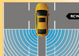
Hệ thống cảnh báo phương tiện và chạm từ phía sau*