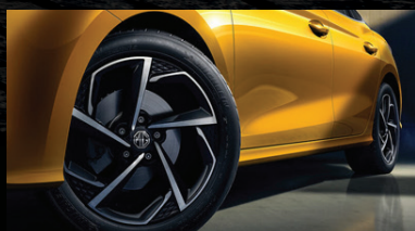
MÂM XE HỢP KIM 17" VỚI 2 TÔNG MÀU MÔ PHỎNG LƯỚI RÌU TOMAHAWK*