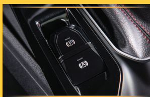
PHANH TAY ĐIỆN TỬ (E-PKB) & GIỮ PHANH TỰ ĐỘNG (AVH)