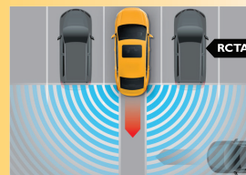
Hệ thống cảnh báo phương tiện cắt ngang phía sau*