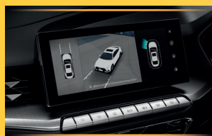
CAMERA 360° HIỂN THỊ 3D*