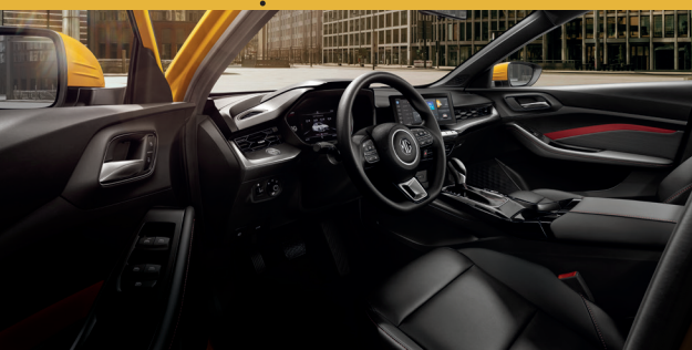
KHOANG NỘI THẤT RỘNG RÃI VỚI GHẾ LÀI THỂ THAO CHỈNH ĐIỆN 6 HƯỚNG*