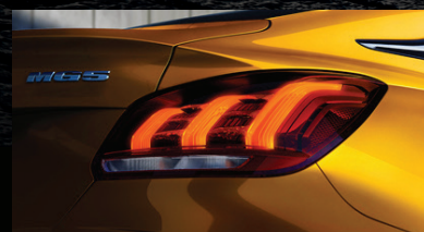
ĐÈN HẬU LED BẮT MẮT