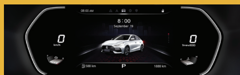
MÀN HÌNH ẢO 7" VIRTUAL COCKPIT*