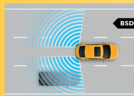
Hệ thống cảnh báo điểm mù*